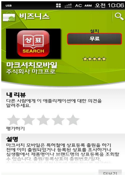
그림 1 (Android 다운 화면)